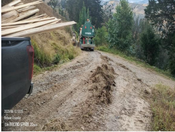
2025/08/12 19:25 Bolívar, Ecuador © TECNO SPARK 2025