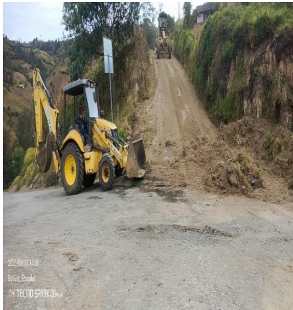
2025/08/13 14:08 Bolívar, Ecuador © TECNO SPARK 2025