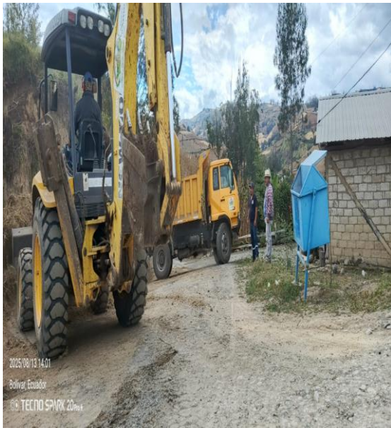
2025/08/13 14:01 Bolívar, Ecuador © TECNO SPARK 2025