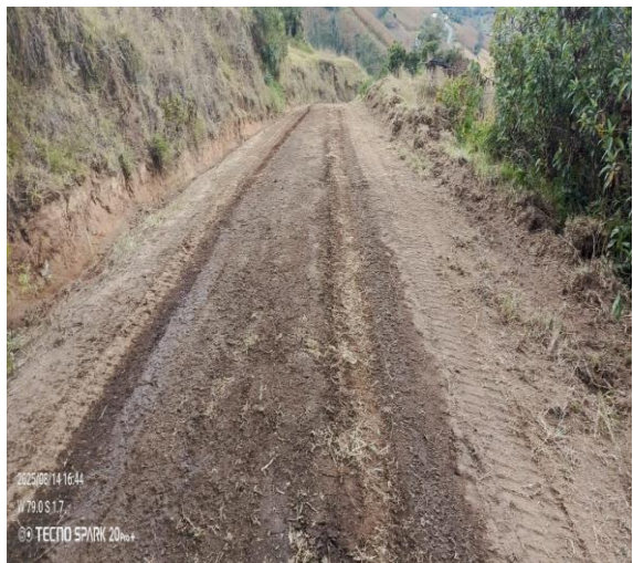
2025/08/14 16:44 W 730 S 17 © TECNO SPARK 2025

Dirección: Calle 10 de Agosto y Eloy Alfaro, Parroquia San Sebastián, Cantón San José de Chimbo