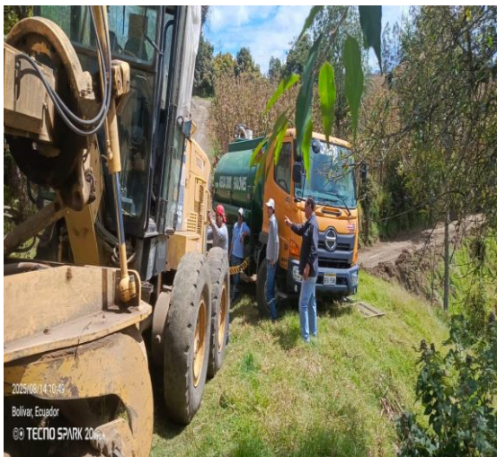
2025/08/14 10:45 Bolívar, Ecuador