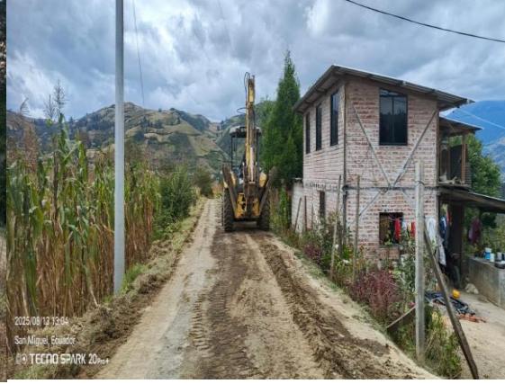
2025/08/12 13:04 San Miguel, Ecuador